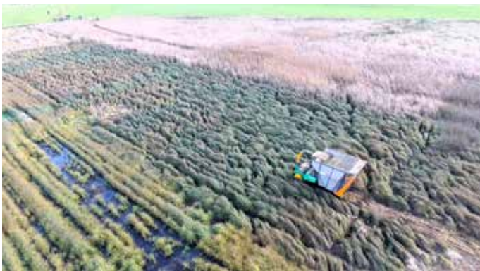
Erntevorführung von oben: Zur Halbzeit des Projekts hat auf der Paludifläche bei Lampertshofen eine öffentliche Schauernte mit Spezialtechnik stattgefunden.