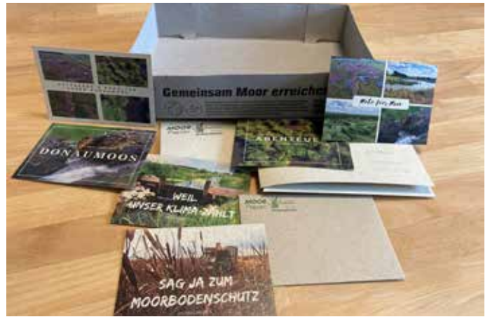
Moorfaser-Portfolio: Zahlreiche Produkte aus Papier und Karton mit unterschiedlichem Paludi-Anteil sind im Zuge der Forschung und Entwicklung entstanden.