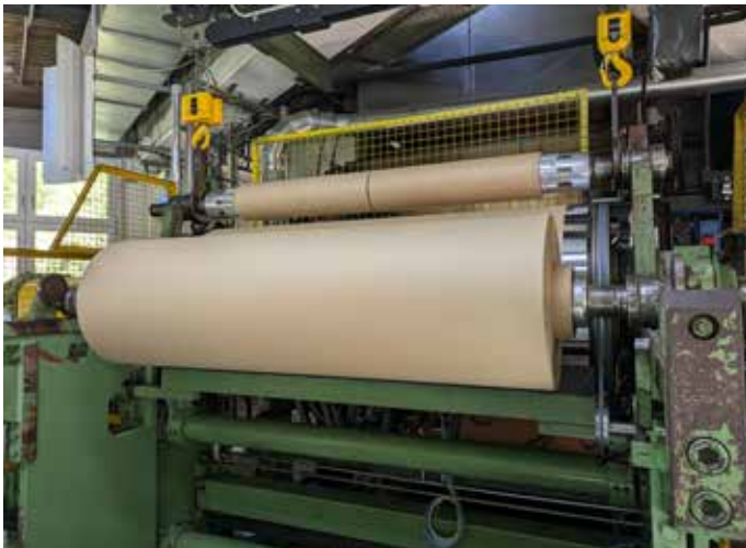
Spannender Prozess: In der Papierfabrik in Gmund entstanden im Laufe des Projekts mehrere Hundert Meter Papier mit unterschiedlichem Anteil an Moorfasern.

Die Projektpartner – u.a. Leipa, Rödl & Partner und Papierfabrik Gmund – zeigen sich überzeugt vom Potenzial der Moorfasern. Für den Zweckverband ist klar: Die gewonnenen Erkenntnisse schaffen eine starke Grundlage für zukünftige Klimaschutz- und Innovationsprojekte.