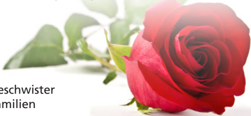
Die Geschwister mit Familien

Und am Ende des Regenbogens sehen wir uns wieder.